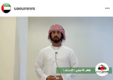
597 views #التسامح_سعادة. Emirates University in more than 65 nationalities of students and members of the faculty and administrators, collect them, the spirit of tolerance and happiness and positive. # UAE _ home _ tolerance #اليوم_العالمي_للتسامح at uaeu, there are More than 65 nationalities of students, faculty members and administrators, contacts together by the spirit of happiness, tolerance and positivity. View 1 comment 6 DAYS AGO - SEE ORIGINAL