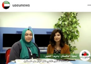
597 views #التسامح_سعادة. Emirates University in more than 65 nationalities of students and members of the faculty and administrators, collect them, the spirit of tolerance and happiness and positive. # UAE _ home _ tolerance #اليوم_العالمي_للتسامح at uaeu, there are More than 65 nationalities of students, faculty members and administrators, contacts together by the spirit of happiness, tolerance and positivity. View 1 comment 6 DAYS AGO - SEE ORIGINAL