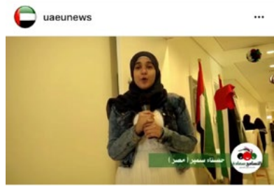
597 views #التسامح_سعادة .. في جامعة الإمارات أكثر من 65 جنسية من طلبة وأعضاء هيئة تدريس وإداريين، تجمعهم روح التسامح والسعادة والإيجابية. #الامارات_وطن_التسامح #اليوم_العالمي_للتسامح At UAEU, there are more than 65 nationalities of students, faculty members and administrators, brought together by the spirit of happiness, tolerance and positivity. View 1 comment 6 DAYS AGO - SEE TRANSLATION