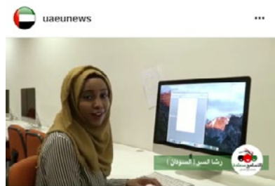
597 views #التسامح_سعادة. Emirates University in more than 65 nationalities of students and members of the faculty and administrators, collect them, the spirit of tolerance and happiness and positive. # UAE _ home _ tolerance #اليوم_العالمي_للتسامح at uaeu, there are More than 65 nationalities of students, faculty members and administrators, contacts together by the spirit of happiness, tolerance and positivity. View 1 comment 6 DAYS AGO - SEE ORIGINAL