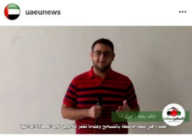
597 views #التسامح_سعادة .. في جامعة الإمارات أكثر من 65 جنسية من طلبة وأعضاء هيئة تدريس وإداريين، تجمعهم روح التسامح والسعادة والإيجابية. #الامارات_وطن_التسامح #اليوم_العالمي_للتسامح At UAEU, there are more than 65 nationalities of students, faculty members and administrators, brought together by the spirit of happiness, tolerance and positivity. View 1 comment 6 DAYS AGO - SEE TRANSLATION