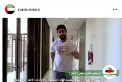
597 views #التسامح_سعادة. Emirates University in more than 65 nationalities of students and members of the faculty and administrators, collect them, the spirit of tolerance and happiness and positive. # UAE _ home _ tolerance #اليوم_العالمي_للتسامح at uaeu, there are More than 65 nationalities of students, faculty members and administrators, contacts together by the spirit of happiness, tolerance and positivity. View 1 comment 6 DAYS AGO - SEE ORIGINAL