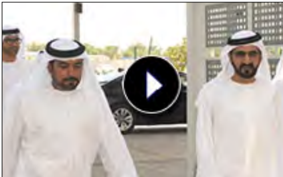
زيارة صاحب السمو الشيخ محمد بن راشد نائب رئيس الدولة لجامعة الإمارات العربية المتحدة