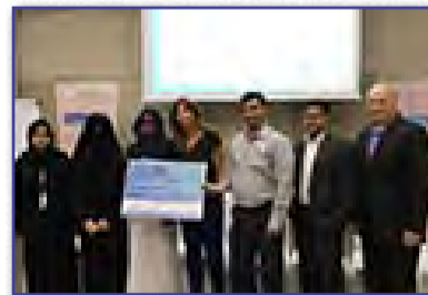
طالبات قسم المحاسبة يحصدن المركز الأول بمسابقة معهد المحاسبين الإداريين