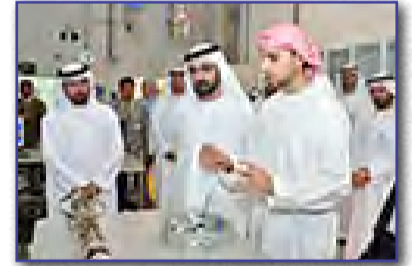
نائب رئيس الدولة خلال تفقدته سير الدراسة في جامعة الإمارات