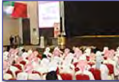
4730 طالباً وطالبة ينضمون لقوافل الطلبة