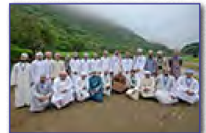
وفد طلابي من جامعة الإمارات في صلاة