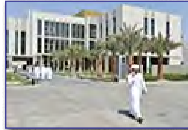
جامعة الإمارات تعتمد 416 طالباً وطالبة في الدراسات العليا للماجستير والدكتوراه